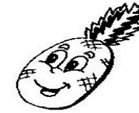
PONTUAÇÃO DOS 3º ANOS NA GINCANA